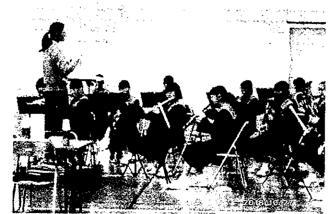
貝塚中学校吹奏楽部の演奏が聴けるのも楽しみのひとつです。