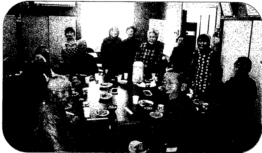
昼は毎回8名前後参加の賑やかなミニ会食です。

平成22年の初会合以来この2月で93回目となり、すっかり定着してきました。自治会館で毎月第4日曜日10時～15時に開催しています。全員でラジオ体操の後、各自好みの種目（輪投げ、マージャン、カラオケ、囲碁将棋、手芸、折り紙、パズル、卓球、歓談など）に参加します。