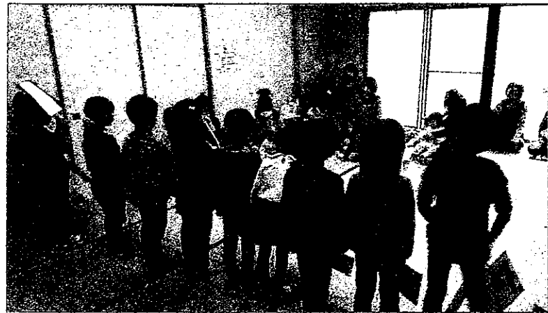
桜木保育所の年長さんが遊びに来てくれました。

子育てサロン「ととけっこー」は、親子（一～三歳児）でわらべうたあそびや読み聞かせ、簡単工作などをして楽しんでいきます。今年度は桜木保育所の年長さんが遊びに来て一緒に工作をしたり、歌や遊戯を元気いっぱい披露してくれました。2019年度も遊びに来てくれます。 サロンは小規模でのんびりした雰囲気です。子育て中の息抜きやお子さんのお友達作りの場としてご利用ください。参加費無料・予約不要です。