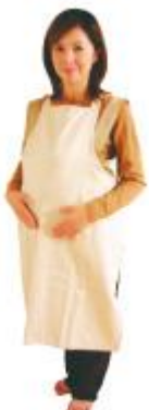
【体験セット装着時】