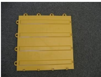
【点字ブロック（線ブロック）】